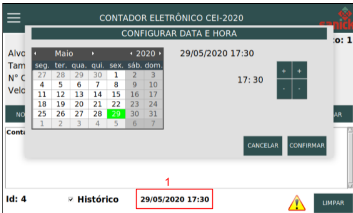
Figura 2: Tela de alteração de Data e Hora.

Para ajustar a data e hora, clique em 1, e após a aparecer a janela de alteração atualize para o horário correto, clique em confirmar para salvar a alteração.