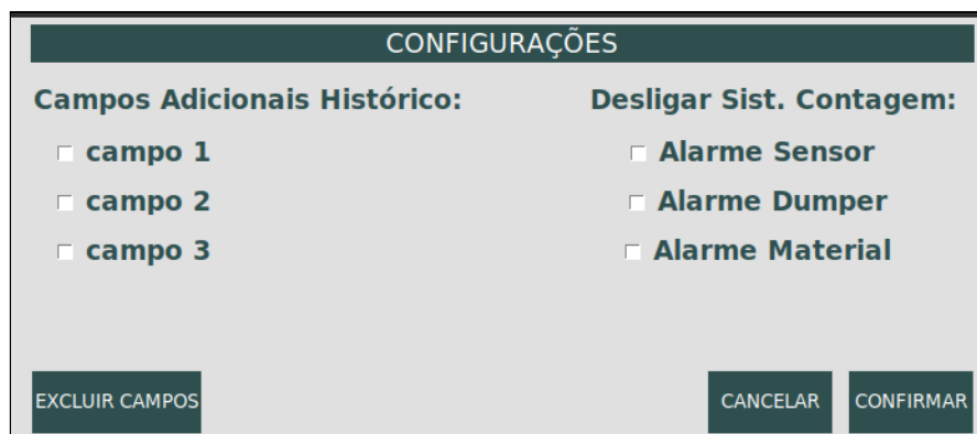
Figura 5: Tela para visualização das Configurações.