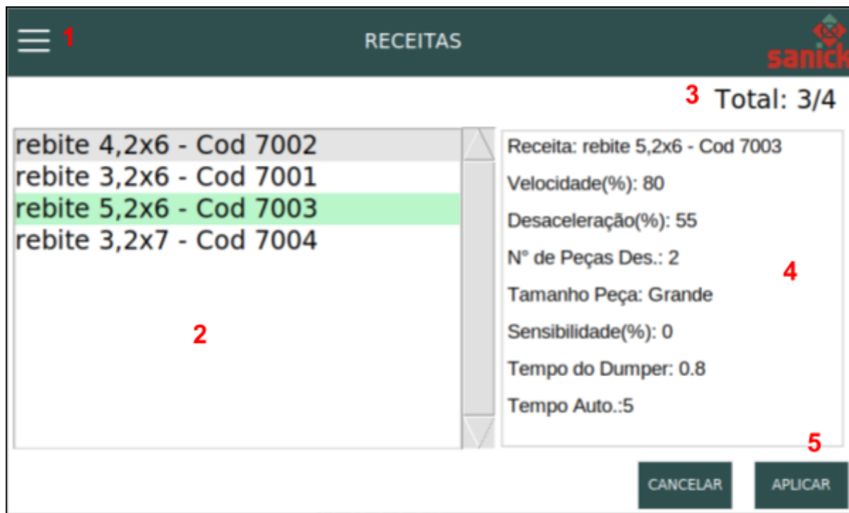
Figura 4: Tela para visualização das Receitas.